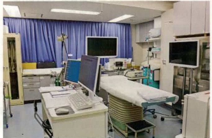
内視鏡室のスナップ写真

検査の受診者数を増やし、大腸がん検診で一番有効な検査が大腸内視鏡検査であることの衆知徹底を図ること、私達内視鏡医は苦痛のない内視鏡検査を行い「命が助かるがん」である大腸がんの早期発見、早期治療に努めていくこと、これらを普及していけるよう内視鏡医の先生方と努めていきたいと思っています。